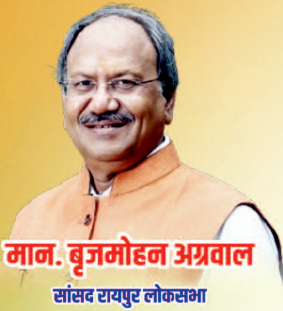
मान. बृजमोहन अग्रवाल सांसद रायपुर लोकसभा